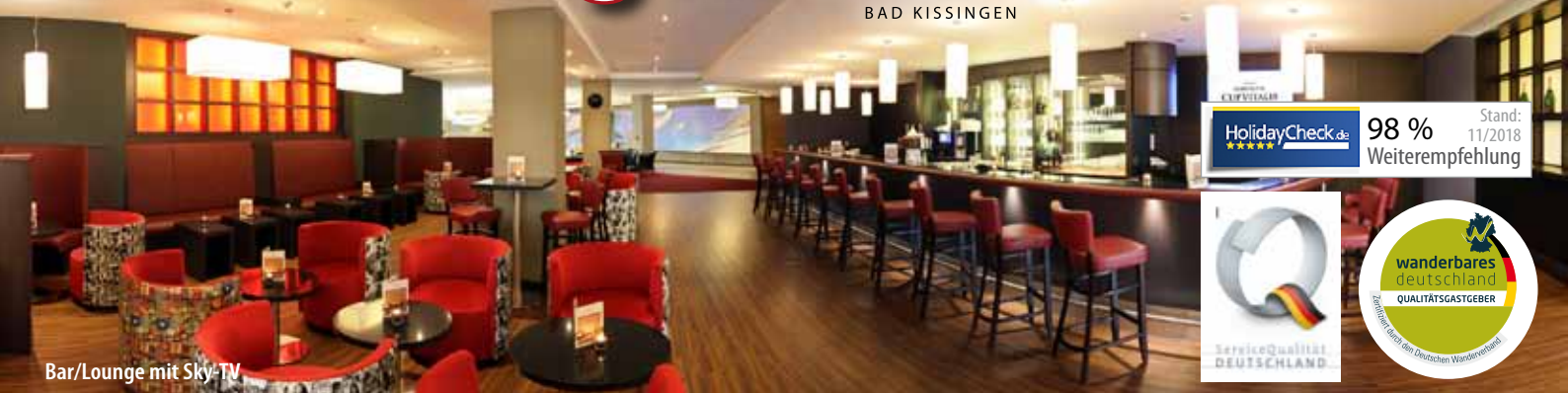
Bar/Lounge mit Sky-TV

PARKHOTEL CUP VITALIS ★★★★ BAD KISSINGEN