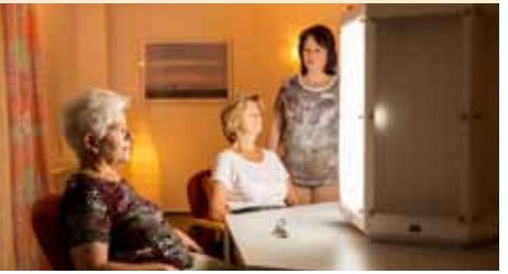
* nur im Oktober buchbar

Buchung & Beratung: in den Geschäftsstellen des Westfälischen Anzeigers, des Soester Anzeigers und der Lüdenscheider Nachrichten.