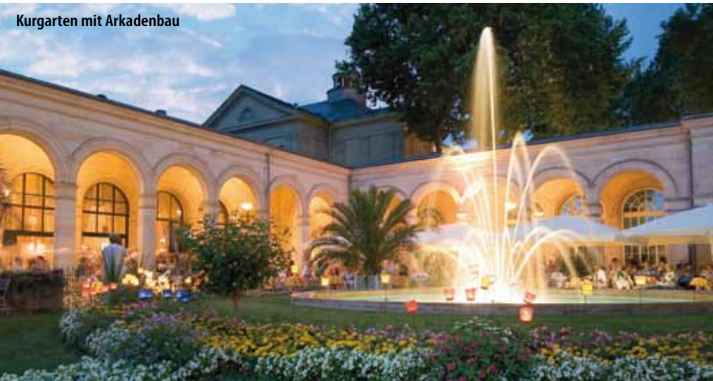
Kurgarten mit Arkadenbau