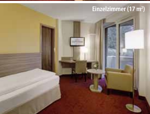
Einzelzimmer (17 m 2 )