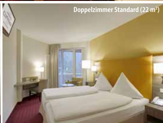
Doppelzimmer Standard (22 m 2 )