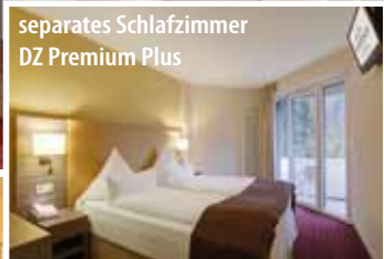
separates Schlafzimmer DZ Premium Plus