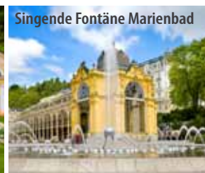
Singende Fontäne Marienbad