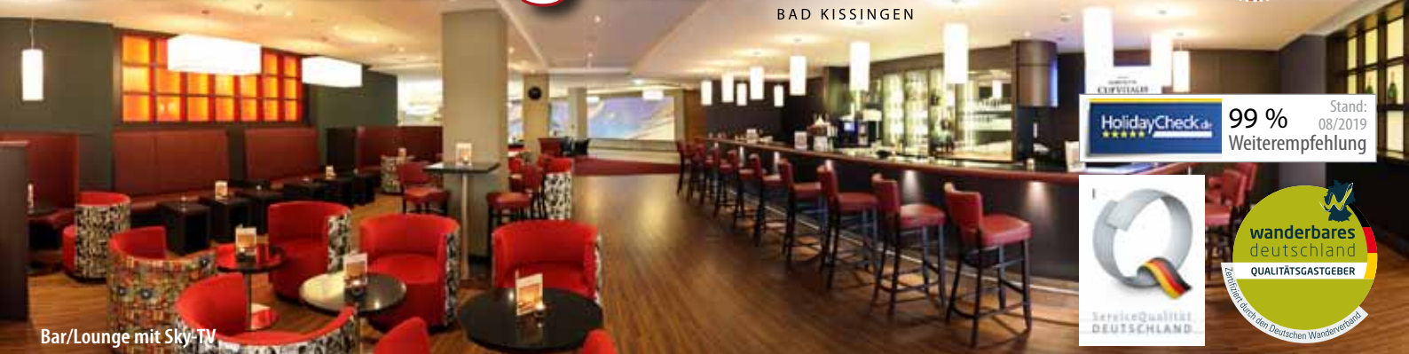
Bar/Lounge mit Sky-TV

PARKHOTEL CUP VITALIS ★★★★ BAD KISSINGEN