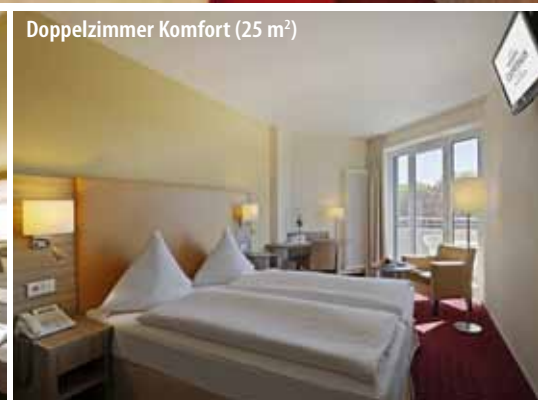
Doppelzimmer Komfort (25 m 2 )