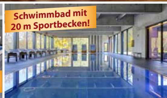
Schwimmbad mit 20 m Sportbecken!

Das 4-Sterne-Parkhotel CUP VITALIS begeistert seine Gäste mit seinem einladenden Ambiente, der traumhaften Aussicht auf Bad Kissingen und die umliegenden Wälder, seinem großen SPA & Sportbereich sowie der 35.000 m 2 großen Parkanlage, die es umgibt.