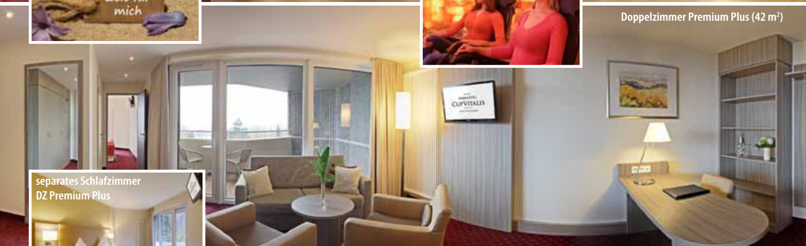
Doppelzimmer Premium Plus (42 m 2 )