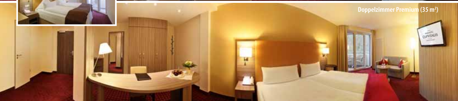
Doppelzimmer Premium (35 m 2 )