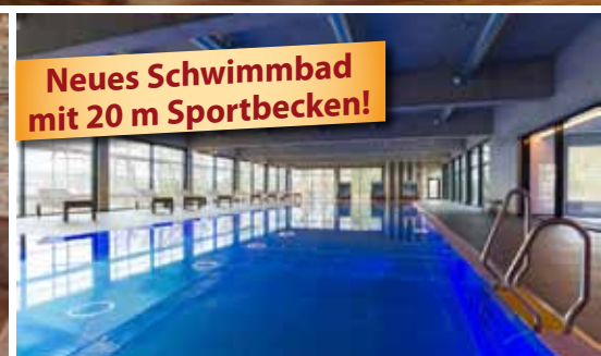
Neues Schwimmbad mit 20 m Sportbecken!

Das 4-Sterne-Parkhotel CUP VITALIS begeistert seine Gäste mit seinem einladenden Ambiente, der traumhaften Aussicht auf Bad Kissingen und die umliegenden Wälder, seinem großen SPA & Sportbereich sowie der 35.000 m 2 großen Parkanlage, die es umgibt.