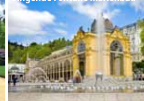
Singende Fontäne Marienbad