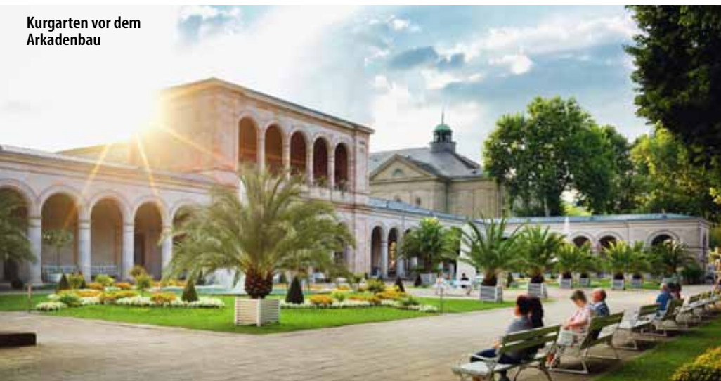
Kurgarten vor dem Arkadenbau