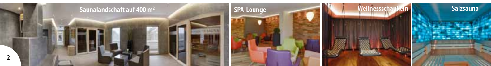
Saunalandschaft auf 400 m 2