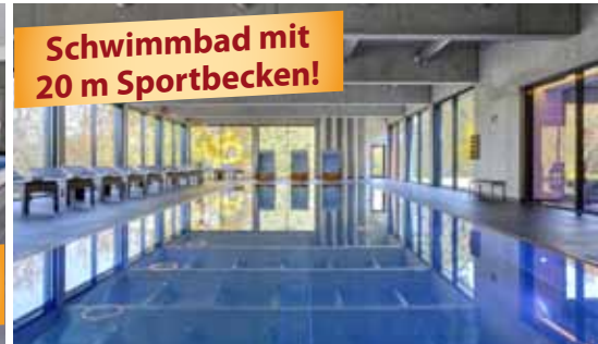
Schwimmbad mit 20 m Sportbecken!

Das 4-Sterne-Parkhotel CUP VITALIS begeistert seine Gäste mit seinem einladenden Ambiente, der traumhaften Aussicht auf Bad Kissingen und die umliegenden Wälder, seinem großen SPA & Sportbereich sowie der 35.000 m 2 großen Parkanlage, die es umgibt.