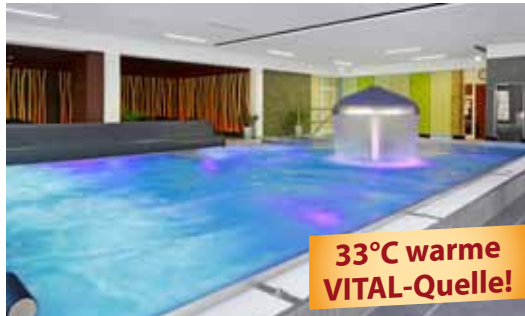
33°C warme VITAL-Quelle!