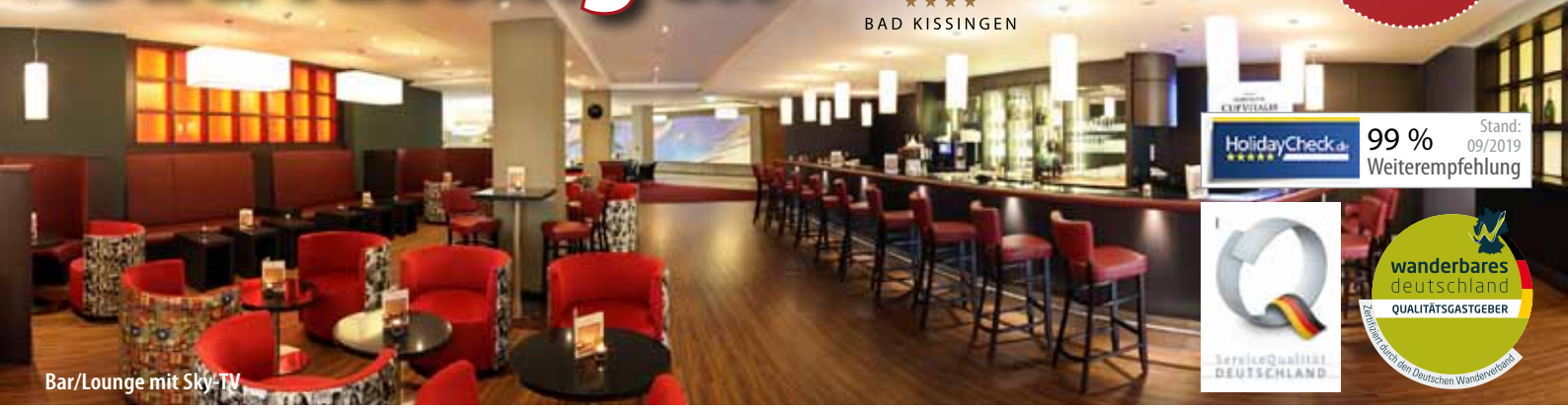
Bar/Lounge mit Sky-TV

HolidayCheck 99% Weiterempfehlung Stand: 09/2019