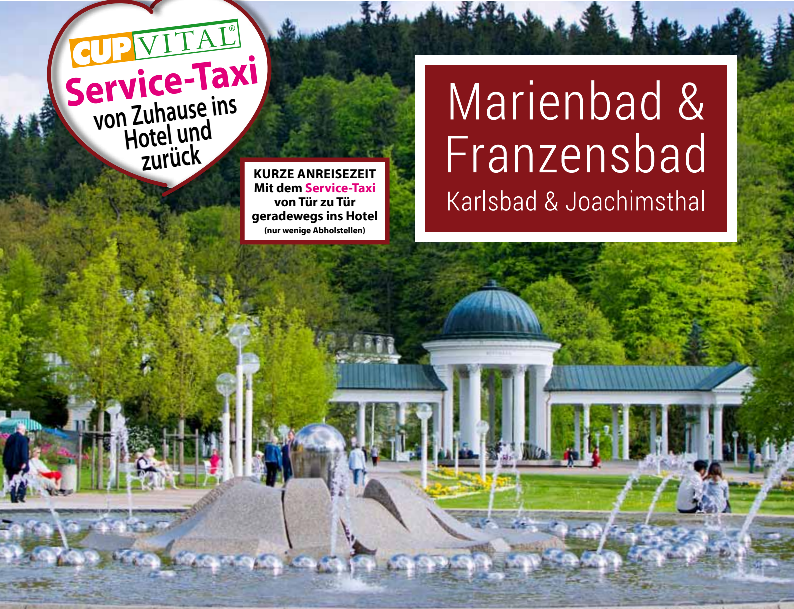
Marienbad, „Singende Fontäne“ und Kolonnade der Karolinenquelle