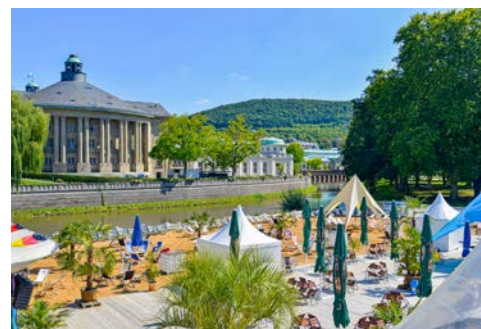
Auch der Stadtstrand an der Saale wird gern besucht

Wie aus einem Kinderbuch entsprungen, wirkt das niedliche, kleine, weiß-blaue Kurbähnle, womit Sie bequem die Stadt erkunden können. Die Strecke zwischen Innenstadt und Tierpark Klaushof wurde zunächst mit einem VW Bulli abgedeckt, heute tourt bereits die dritte Generation der beliebten Kleinbahn durch die Straßen Bad Kissingens.