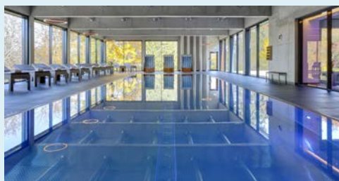
20 m Sportbecken im Hotel