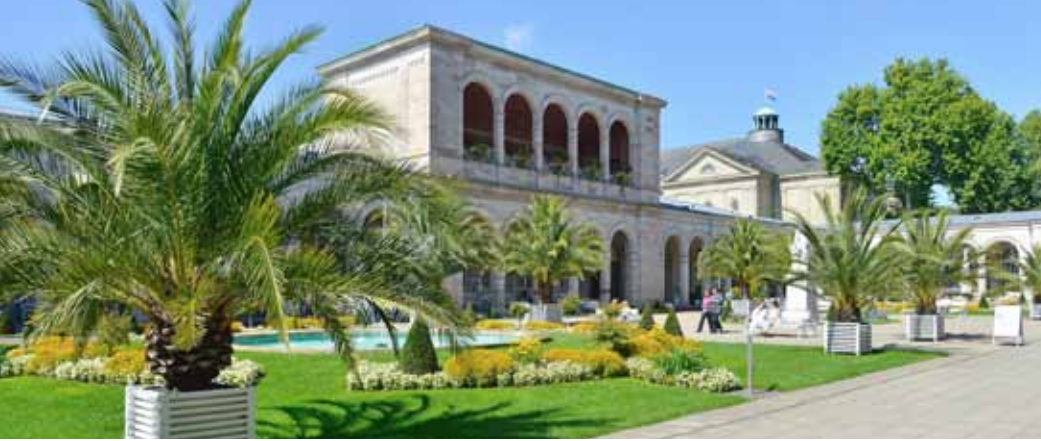
Kurpark mit Wandelhalle