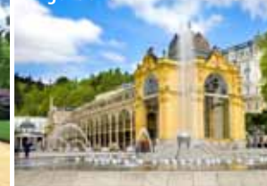
Singende Fontäne Marienbad