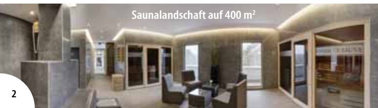
Saunalandschaft auf 400 m 2

* Die Kurtaxe (3,60 € p. P./Tag) ist vor Ort zu zahlen.