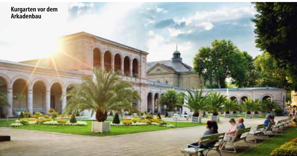
Kurgarten vor dem Arkadenbau