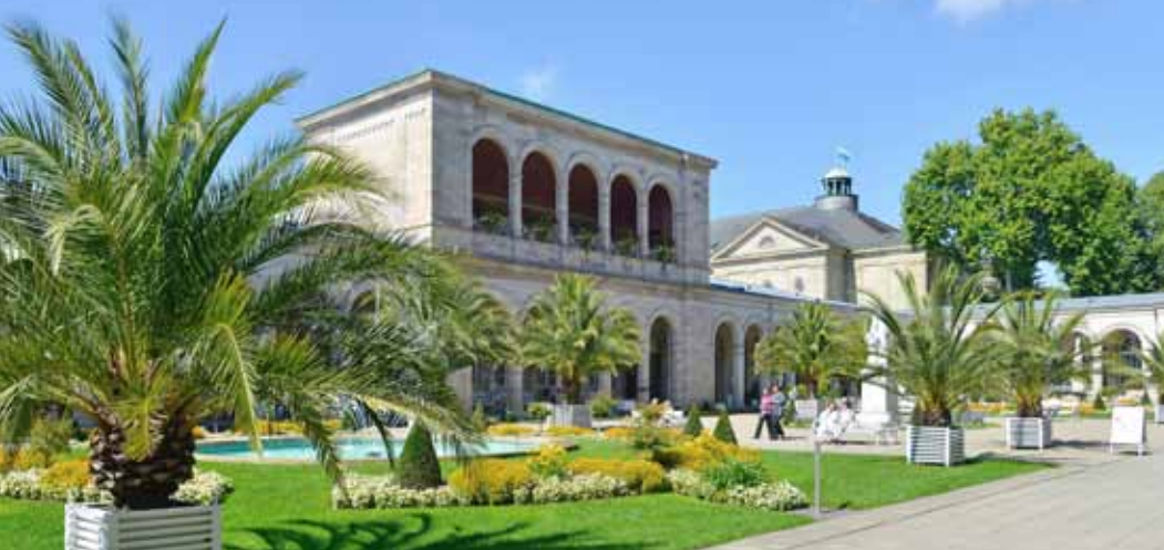
Kurgarten vor dem Arkadenbau