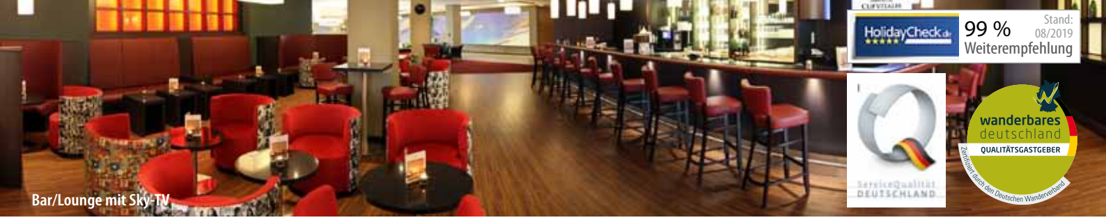
Bar/Lounge mit Sky-TV

PARKHOTEL CUP VITALIS ★★★★ BAD KISSINGEN