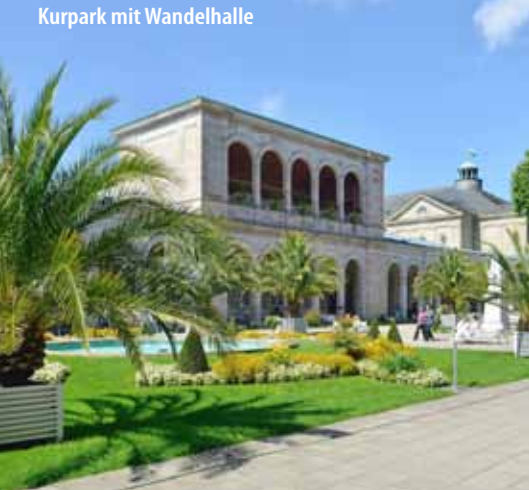
Kurpark mit Wandelhalle