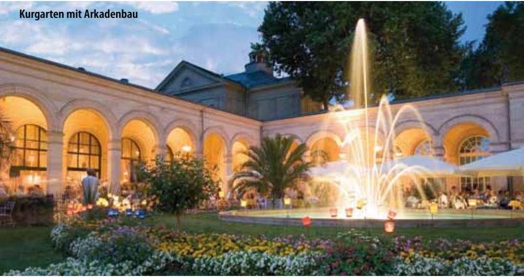
Kurgarten mit Arkadenbau