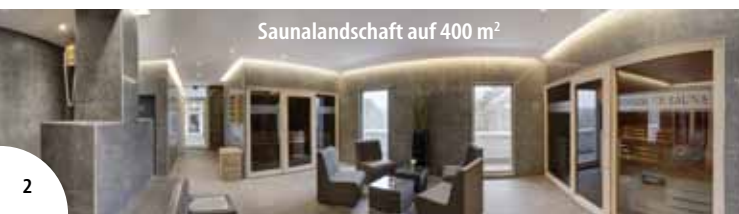
Saunalandschaft auf 400 m 2