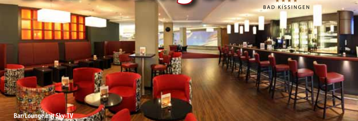
Bar/Lounge mit Sky-TV

HolidayCheck 99% Stand: 08/2019 Weiterempfehlung