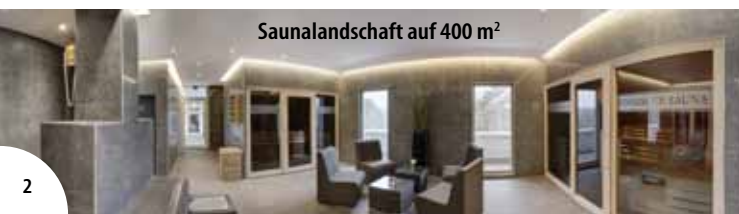
Saunalandschaft auf 400 m 2

* Die Kurtaxe (3,60 € p. P./Tag) ist vor Ort zu zahlen.