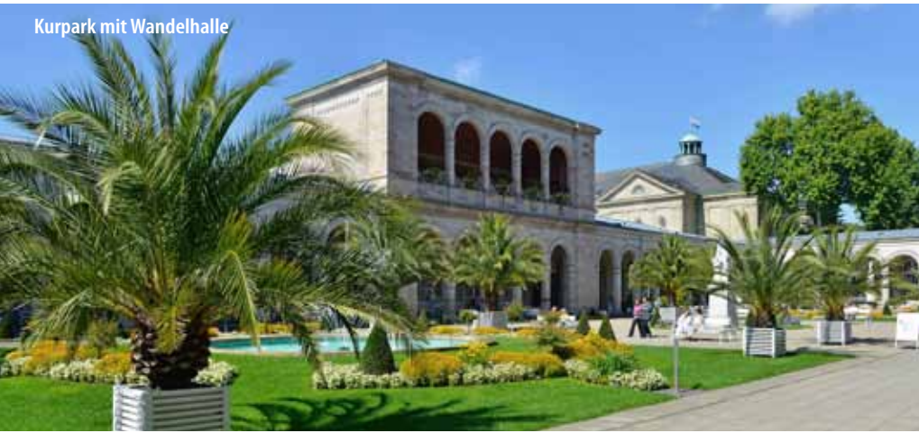
Kurpark mit Wandelhalle