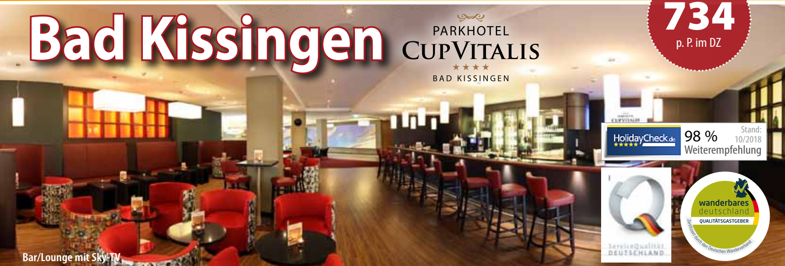
Bar/Lounge mit Sky-TV

PARKHOTEL CUP VITALIS ★★★★ BAD KISSINGEN