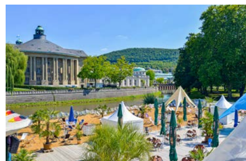
Auch der Stadtstrand an der Saale wird gern besucht

Wie aus einem Kinderbuch entsprungen, wirkt das niedliche, kleine, weiß-blaue Kurbähnle, womit Sie bequem die Stadt erkunden können. Die Strecke zwischen Innenstadt und Tierpark Klaushof wurde zunächst mit einem VW Bulli abgedeckt, heute tourt bereits die dritte Generation der beliebten Kleinbahn durch die Straßen Bad Kissingens.