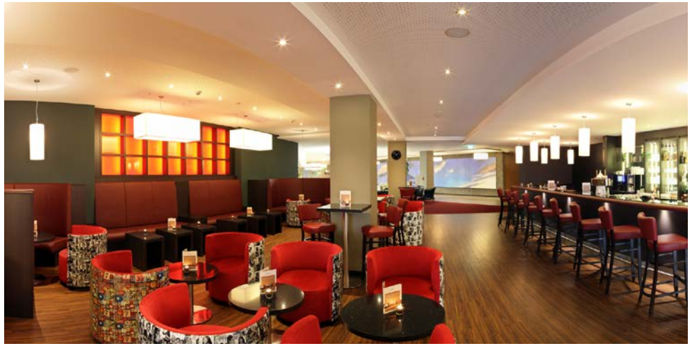
Genießen Sie ein Glas Wein in gemütlicher Atmosphäre

Mit dem CUP VITAL-Service-Taxi reisen Sie von Zuhause ins Hotel und zurück inklusive Kofferservice.