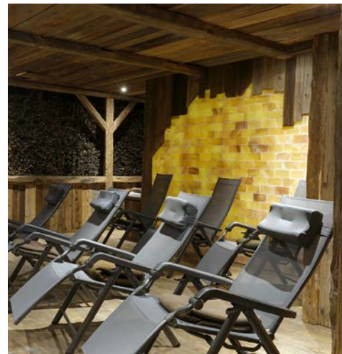
Im hoteleigenen Gradierwerk

verpassen, zumal er hervorragend zu Fuß oder per Ausflugsschiff mit Abfahrt im Rosengarten zu erreichen ist. Im Volksmund heißt er „Saline“, wobei er nur ein Überbleibsel der ursprünglichen Salzgewinnungsanlagen (Salinen) darstellt. Die einstige Gesamtlänge von 2,2 km kann die Anlage nicht mehr vorweisen, was nach der Einstellung der Salzgewinnung auch nicht mehr nötig war. Als therapeutisches Element gewann der Gradierbau dagegen immer mehr an Bedeutung. Unternehmen Sie einen Wandelgang durch den Gradierbau und stellen Sie fest, wie wohltuend das bewusste Einatmen der reinen, salzhaltigen und gesunden Luft sein kann.