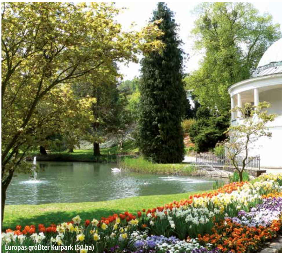
Europas größter Kurpark (50 ha)