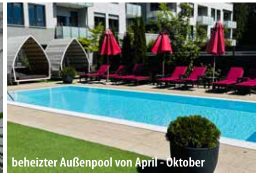
beheizter Außenpool von April - Oktober

Entdecken Sie die Schönheit Bad Wildungen, seines Kurviertels und der Region rund um den Edersee. Ein Spaziergang durch die engen Gassen der Altstadt fühlt sich an wie eine Reise in die Vergangenheit. Schmucke Fachwerkhäuser mit kunstvollen Details und schiefen Winkeln versprühen eine nostalgische Atmosphäre. Die Architektur ist faszinierend und gewährt einen Einblick in vergangene Zeiten. Auf der Wildunger Flaniermeile Brunnenallee findet sich ein Jugendstilhaus neben dem anderen sowie einige sehenswerte Brunnen, zum Beispiel der Kurschattenbrunnen. Der Veranstaltungskalender der Stadt Bad Wildungen sorgt für einen unterhaltsamen Aufenthalt – von Stadtfesten über Ausstellungen bis hin zu größeren Festivals. Das Kurviertel von Bad Wildungen ist bekannt für seine mondänen Bauten und den großen Kurpark. Die Wandelhalle, ein zentraler Treffpunkt, wurde vor vielen Jahren umgebaut – modern und trotzdem traditionell. Bei einem Ausflug können Sie Hessens einzigen Nationalpark Kellerwald-Edersee erkunden. Bad Wildungen ist zu jeder Jahreszeit attraktiv und ideal für einen Gesundheitsurlaub!