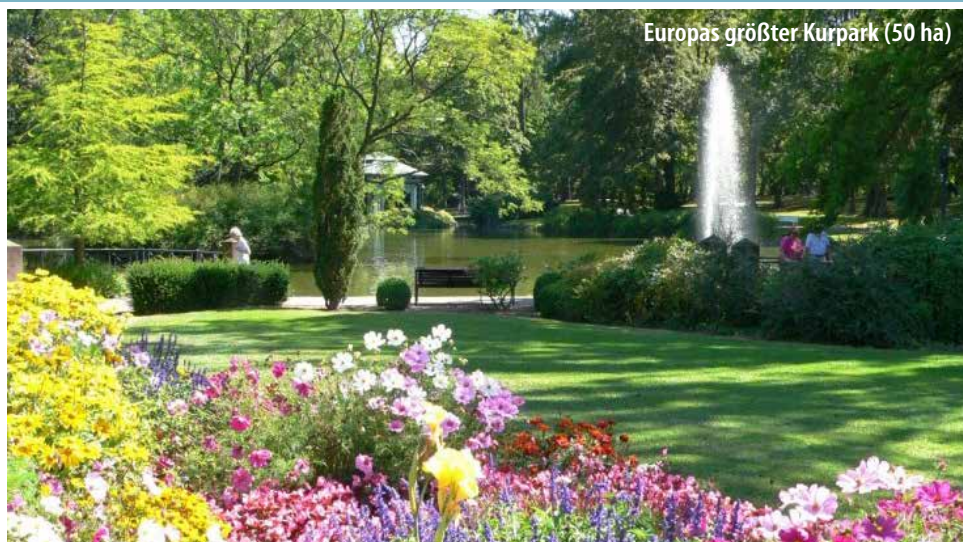
Europas größter Kurpark (50 ha)