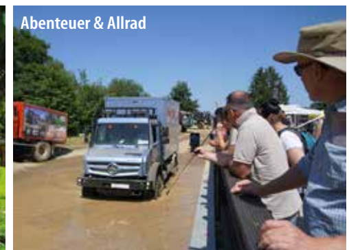
Abenteuer & Allrad