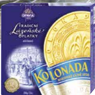
Beliebtes Souvenir: die Marienbader Oblaten