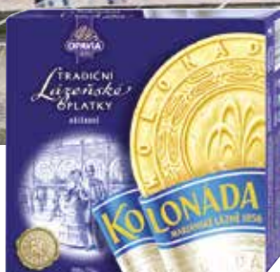
Beliebtes Souvenir: die Marienbader Oblaten

Ein für Alleinreisende Einzelzimmer im Glückshotel ohne Zuschlag!