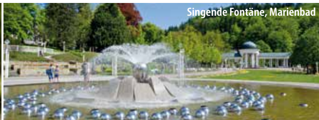
Singende Fontäne, Marienbad