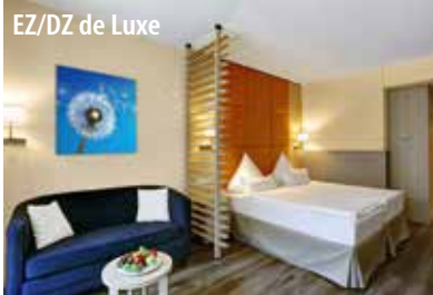
EZ/DZ de Luxe