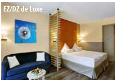
EZ/DZ de Luxe