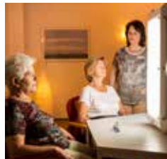
WINTERSONNE (1) (LICHTTHERAPIE)