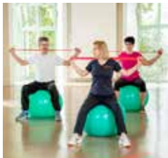
FIT IM ALLTAG