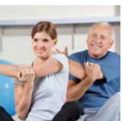
VITAL & AKTIV – fit bleiben