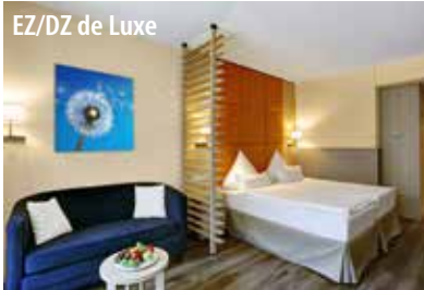
EZ/DZ de Luxe