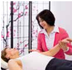
TRADITIONELLE CHINESISCHE MEDIZIN