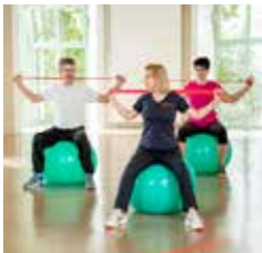
FIT IM ALLTAG