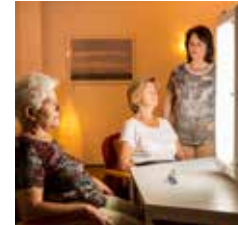
WINTERSONNE (1) (LICHTTHERAPIE)