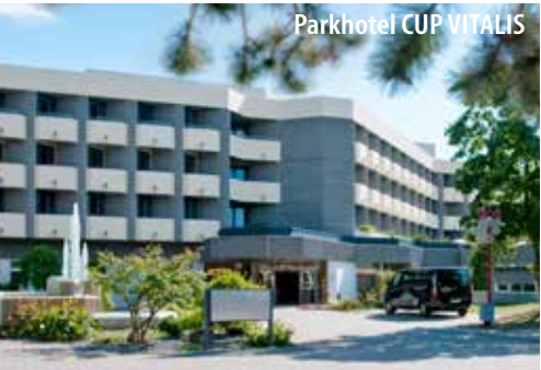
Parkhotel CUP VITALIS