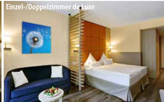
Einzel-/Doppelzimmer de Luxe

Bad Kissingen liegt an der fränkischen Saale, südlich der Rhön im Bundesland Bayern und gehört seit 2021 zum UNESCO-Welterbe „Die bedeutendsten Kurstädte Europas“. Der historische Kurort verkörpert das Phänomen der europäischen Kur auf besondere Art und Weise. Das Bild der Stadt wird vor allem durch die prächtigen Parks und die prunkvollen historischen Bauten geprägt. Hier stehen der Kurpark mit Wandelhalle und Regententbau sowie die Bayerische Spielbank hervor. Besonders sehenswert sind auch das Bismarck-Museum und die historische Altstadt mit Geschäften und typisch fränkischer Gastronomie. Mit dem CUP VITAL Service-Taxi reisen Sie ganz bequem von Zuhause ins Hotel und zurück!