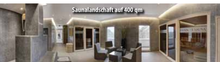
Saunalandschaft auf 400 qm

* Die Kurtaxe (3,50 € p. P./Tag) ist vor Ort zu zahlen.