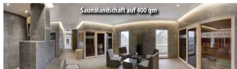
Saunalandschaft auf 400 qm