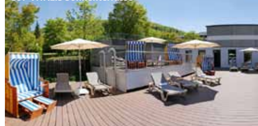
CUP VITALIS Sonnenterrasse

Es gelten die Allgemeinen Reisebedingungen der CUP VITALIS Hotel- und Betriebsgesellschaft mbH, Bremen. Druckfehler und Irrtümer trotz sorgfältiger Prüfung vorbehalten. Preise und Programmänderungen vorbehalten. Die Preise sind Paketpreise. Eine Nichtanspruchnahme einer Leistung hat keine Preisminderung oder einen Erstattungsanspruch zur Folge.