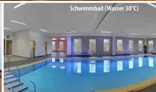
Schwimmbad (Wasser 30°C)

Das 4-Sterne-Parkhotel CUP VITALIS begeistert seine Gäste mit seinem einladenden Ambiente, der traumhaften Aussicht auf Bad Kissingen und die umliegenden Wälder, seinem großen Spa & Sportbereich sowie der 35.000 qm großen Parkanlage, die es umgibt.